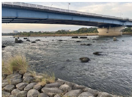
利根川 (大渡橋上流)