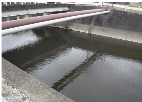
新谷田川放水路（利根川支川） （中里大橋付近）