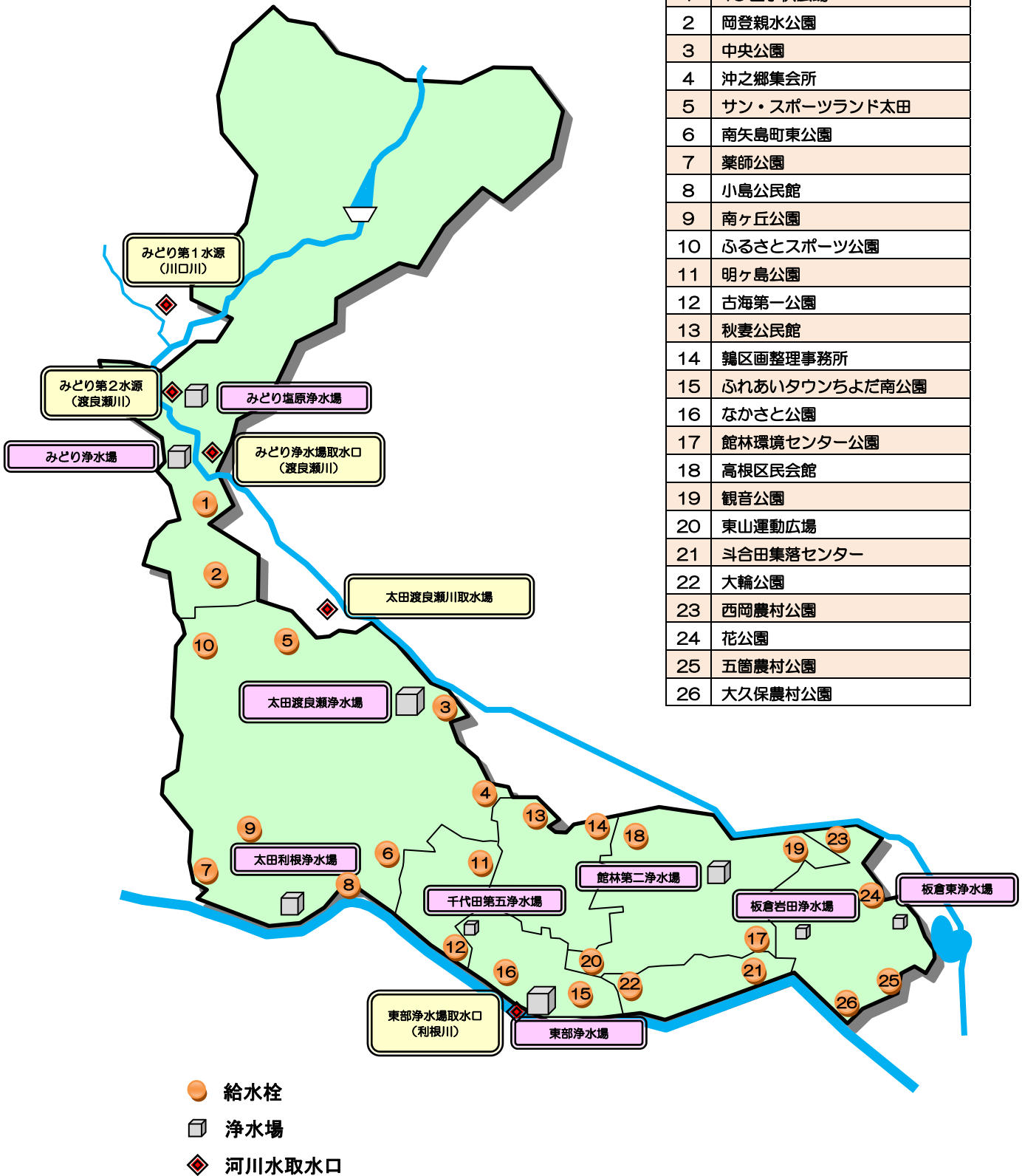
図1 水質基準検査 検査地点