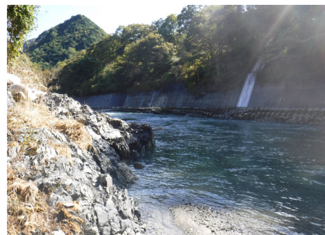
渡良瀬川 (源五郎沢堆積場付近)