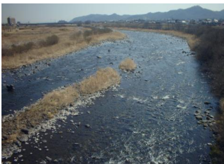
渡良瀬川 (太田渡良瀬川取水場付近)