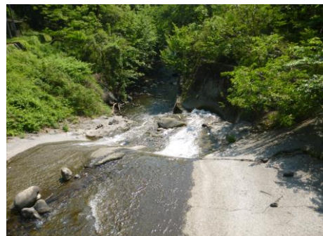
川口川 (みどり第 1 水源付近)