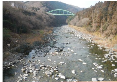
渡良瀬川 (新栄橋付近)