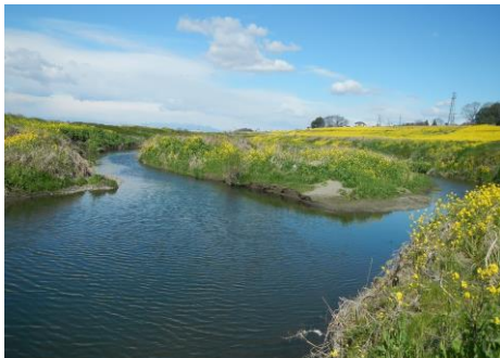
利根川 (休泊川合流点付近)